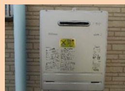
すまいる・ふれんず 給湯器整備