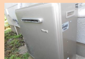
あっとホーム 給湯器整備

皆様からの助成金は、親愛会を利用する方たちがより良く生活するために使われています。