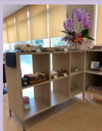
茶房ひととき 棚整備