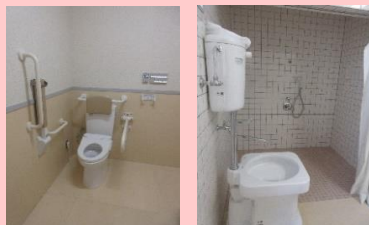
(左) 多目的トイレ設置 (右) シャワー室設置