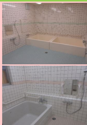
(上) 大浴室改修 (下) 小浴室改修