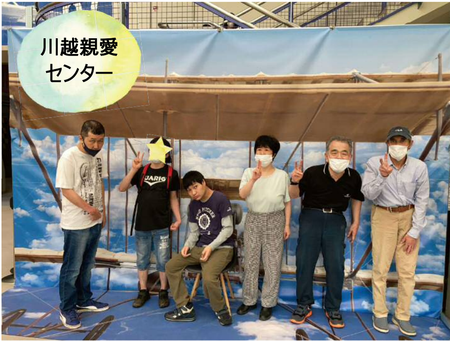
川越親愛センター

コロナに負けず、今年度も様々な取り組みを行っています。 少しずつ外出の機会も増えてきました。 また、施設内でも工夫を凝らし活動しています。 それでは、親愛会の各事業所の様子をご紹介します！